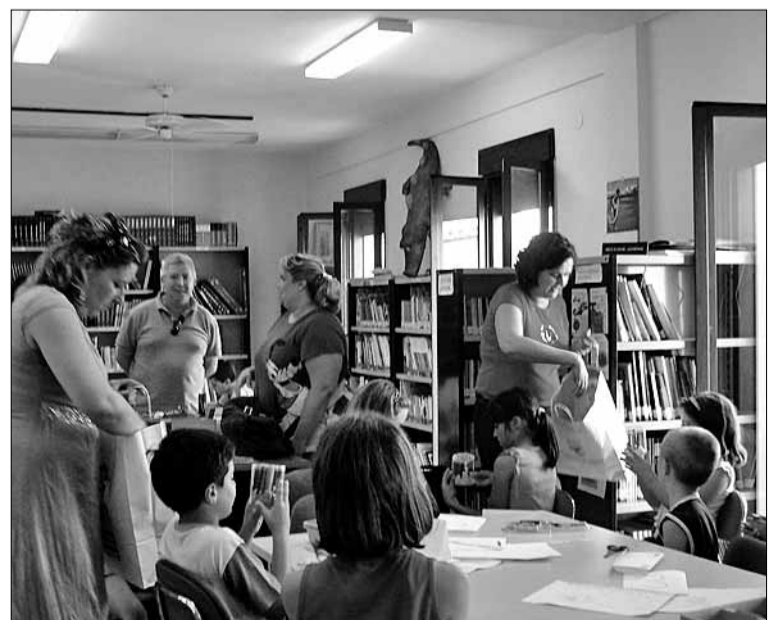
■ Clausura de Biblioactiva 2009.

Tras esta experiencia, la valoración desde la Concejalía de Cultura es muy positiva, ya que muchos de los asistentes ni siquiera conocían la ubicación de la biblioteca municipal. Por ello, desde el Ayuntamiento se ha decidido ampliar esta iniciativa lectora y se va a trasladar la biblioteca infantil a la calle, durante los meses de julio y agosto. La biblioteca va a ubicarse en la Era del Lugar en las actividades de ‘Explayate’, de lunes a viernes, de 19 a 21 horas, donde además de juegos tradicionales para niños, se incluirá el taller de biblioteca activa.