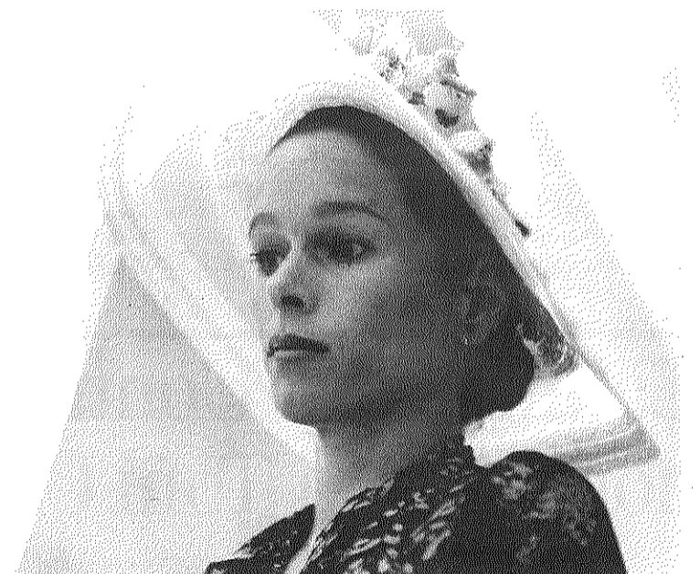
La actriz californiana Geraldine Chaplin, premio 'Almería, tierra de cine'.

Además, la jornada ofrece el documental 'Del corto a Hollywood', a las 18 horas en el Museo de Almería, un trabajo, que se verá en la sección 'Canal Plus. Tras la pista del cine', que aborda el salto a la industria norteamericana de talentos españoles formados en el cortometraje nacional.