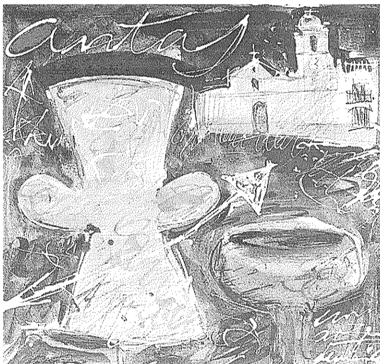
■ Un detalle de la portada de la revista 'Axarquía'.