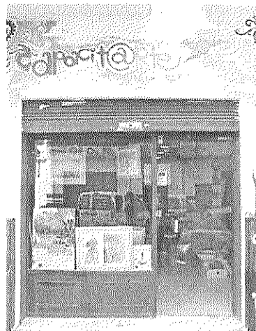
■ La nueva sede de Capacitarte.

► La Asociación Capacitarte presenta su nueva sede que será inaugurada próximamente. A pie de calle y con más fácil acceso para todos a las varias actividades artísticas, esta nueva sede contará ya el próximo 14 de Septiembre del inicio de un nuevo curso artístico más accesible. Informaciones y horario en la web www.capacitarte.com