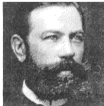
■ Ventura de Callejón / LA VOZ

► Dalías acogerá el viernes la presentación de una biografía sobre el diplomático